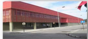
EP PUERTO MONTT