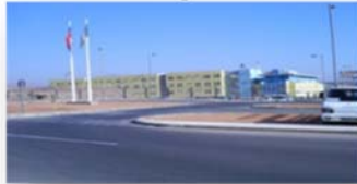
EP. ALTO HOSPICIO