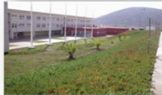
EP. LA SERENA