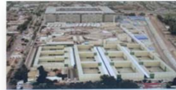
EP SANTIAGO 1