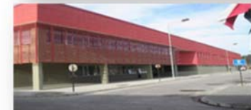
EP PUERTO MONTT